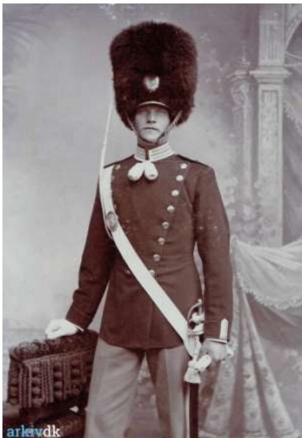
- og som garder