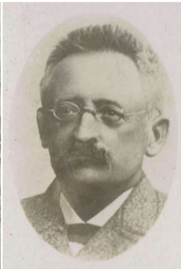
– og her i en måske mere typisk udgave